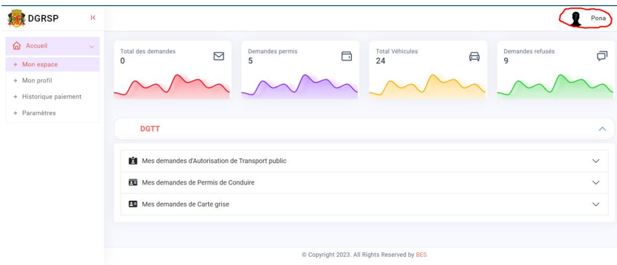
Figure 2 : Profil utilisateur

Lorsque vous accédez à la plateforme, vous arrivez à la page suivante